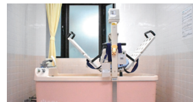
機械浴(ベストライフ白石)