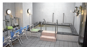
一般浴(ベストライフ白石)

語らいながら入浴を楽しめる、 大浴場タイプの一般浴と、寝たきりの方でもご入浴いただける機械浴があります。安全に着替えや移動、入浴ができるよう、さまざまな配慮がされています。