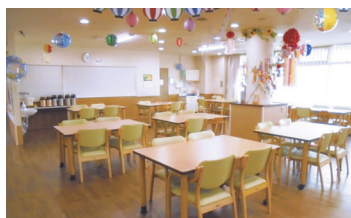
食堂(ベストライフ白石)

食堂や機能訓練スペース兼多目的スペースでは仲間同士の交流を深めていただけます。健康管理室では看護職員が日々の健康管理やさまざまな健康相談をお受けします。ヘルパーステーションでは休日夜間を問わず、介護職員がご入居者の暮らしをサポートします。