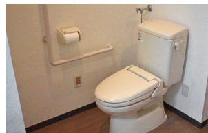
暖房便座トイレ(ベストライフ白石)