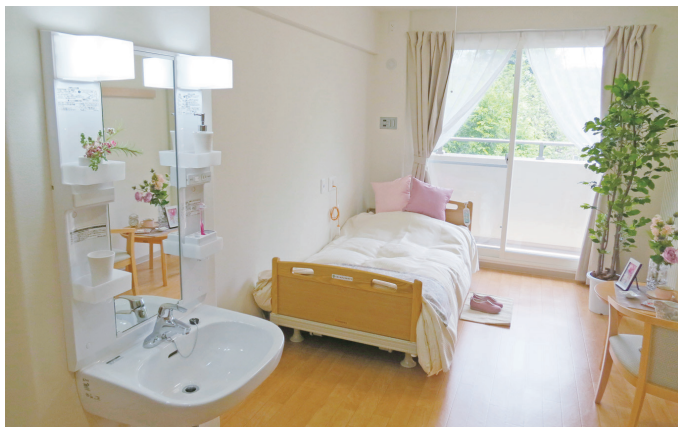
居室イメージ(ベストライフ真駒内)