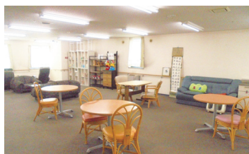
機能訓練スペース兼多目的スペース(ベストライフ白石)