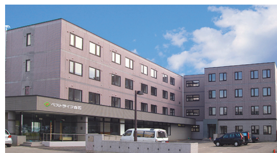
ベストライフ白石 (2006年7月撮影)

ベストライフ白石 | 〒003-0027 北海道札幌市白石区本通14-北5-15