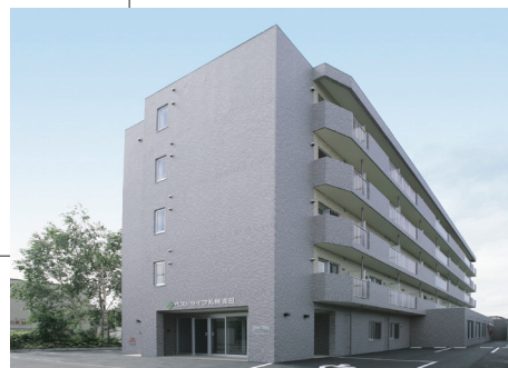
ベストライフ札幌清田 (2006年7月撮影)