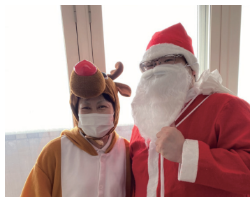
クリスマス(ベストライフ札幌清田)

ベストライフ札幌清田では、ご入居者様に笑顔で健やかにお過ごしいただくために、職員が一丸となってさまざまな行事を企画しています。書道、カラオケ、絵葉書、フラワーアレンジメントやチェアエクササイズ、音楽療法など、ご入居の皆様が「参加したくなる」を大切に、さまざまなレクリエーションを実施しています。季節の行事や職員による創作演劇も大変好評です。