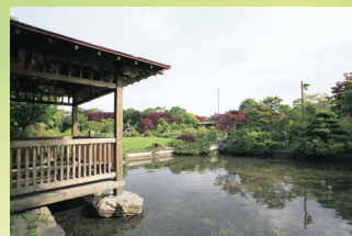
平岡樹芸センター