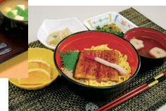
行事食(土用の丑の日)