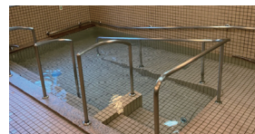
一般浴(ベストライフ札幌清田)

語らいながら入浴を楽しめる、 大浴場タイプの一般浴と、寝たきりの方でもご入浴いただける機械浴があります。安全に着替えや移動、入浴ができるよう、さまざまな配慮がされています。