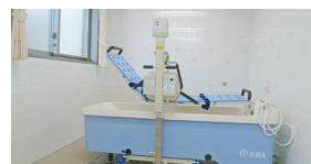
機械浴(ベストライフ真駒内)