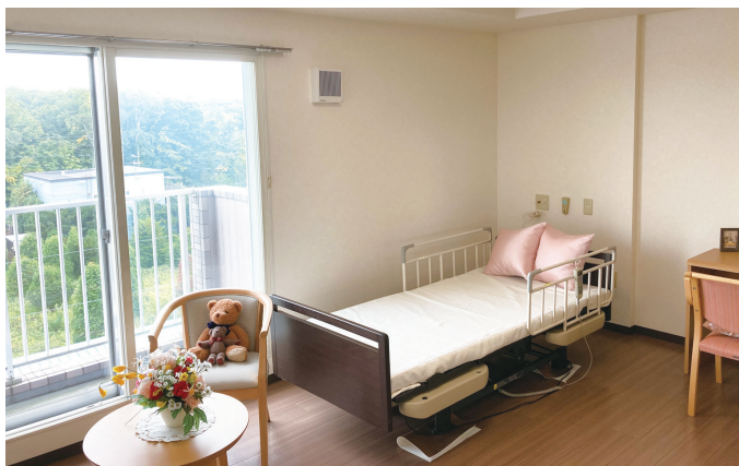
居室イメージ(ベストライフ札幌清田)