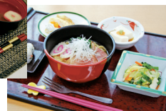
郷土料理(和歌山県)