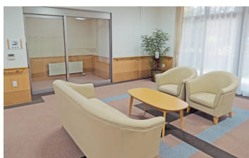
談話コーナー(ベストライフ真駒内)