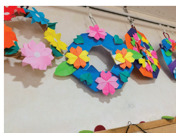
ご入居者様作品(ベストライフ札幌清田)