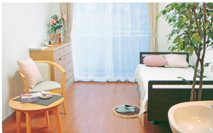
居室イメージ (ベストライフ印西)