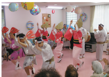
納涼祭(ベストライフ小岩)

ベストライフ小岩では、毎日をより豊かに過ごしていただくために、お花見や夏祭りをはじめとする季節の行事やお誕生会、プロの講師を招いての音楽療法やシニア体操など、さまざまなレクリエーションを企画・実施しています。職員による「思い出の歌」やチェアエクササイズは大変好評です。また、近隣には公園があり、季節に合わせてお花の鑑賞に出かけています。