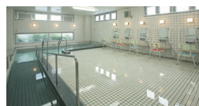
一般浴 (ベストライフ世田谷)

語らいながら入浴を楽しめる、大浴場タイプの一般浴と、寝たきりの方でもご入浴いただける機械浴があります。安全に着替えや移動、入浴ができるよう、さまざまな配慮がされています。