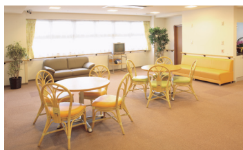
談話コーナー (ベストライフ聖蹟桜ヶ丘)