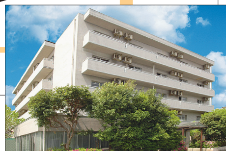
ベストライフ小岩 (2005年3月撮影)