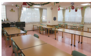
食堂 (ベストライフ小岩)

食堂や談話コーナーでは仲間同士の交流を深めていただけます。健康管理室では看護職員が日々の健康管理やさまざまな健康相談をお受けします。ヘルパーステーションでは休日夜間を問わず、介護職員がご入居者様の暮らしをサポートします。