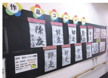
ご入居者様作品(ベストライフ小岩)