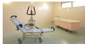
機械浴 (ベストライフ世田谷)