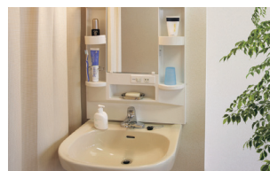
車いす対応洗面台 (ベストライフ溝の口)