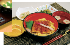
行事食(土用の丑の日)