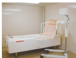
機械浴 (ベストライフ三郷中央)