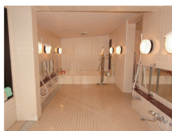
一般浴 (ベストライフ川口)