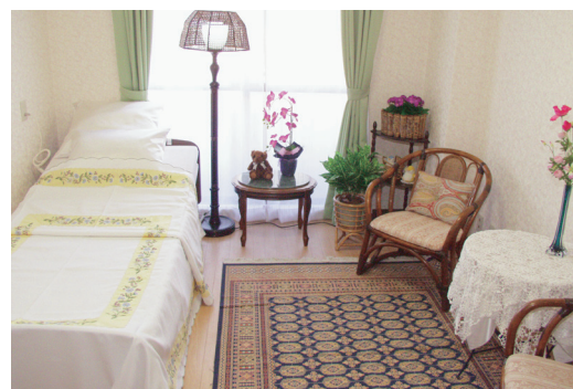
居室イメージ (ベストライフ川口)